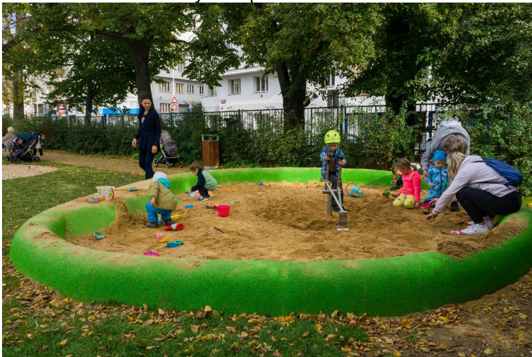
Obr.: Inspirativní foto – betonové pískoviště s EPDM lemem

3D pískoviště bude atypicky vymodelováno na místě v konkrétním tvaru, např. viz níže. Konstrukce bude zhotovena z betonu tř. C25/30 (B25) s výztuží kari sítě. Hrany konstrukce budou zaoblené pro možnost pohodlného sezení, ale také modelaci báboviček. Svrchní pohledovou vrstvu tvoří EPDM granulát, který bude nanesen na betonovou konstrukci po penetraci betonu speciálním polyurethanovým pojivem v 11 mm vrstvě.