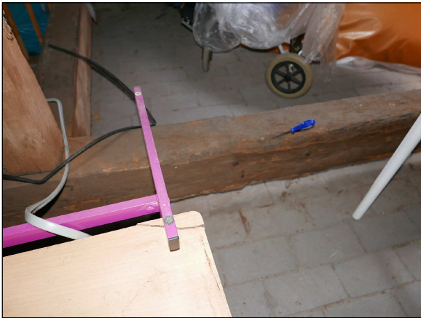
Uhníly vazný trám