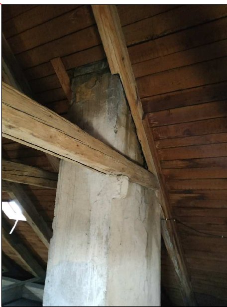
Zatékání u komína