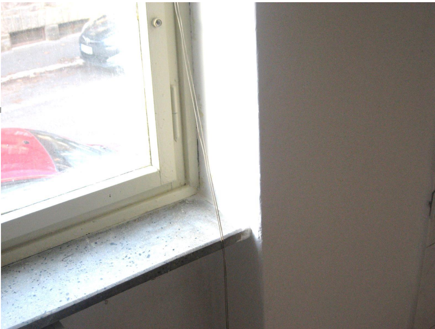
DETAIL VNITŘNÍHO OSTĚNÍ A KAMENÉHO PARAPETU