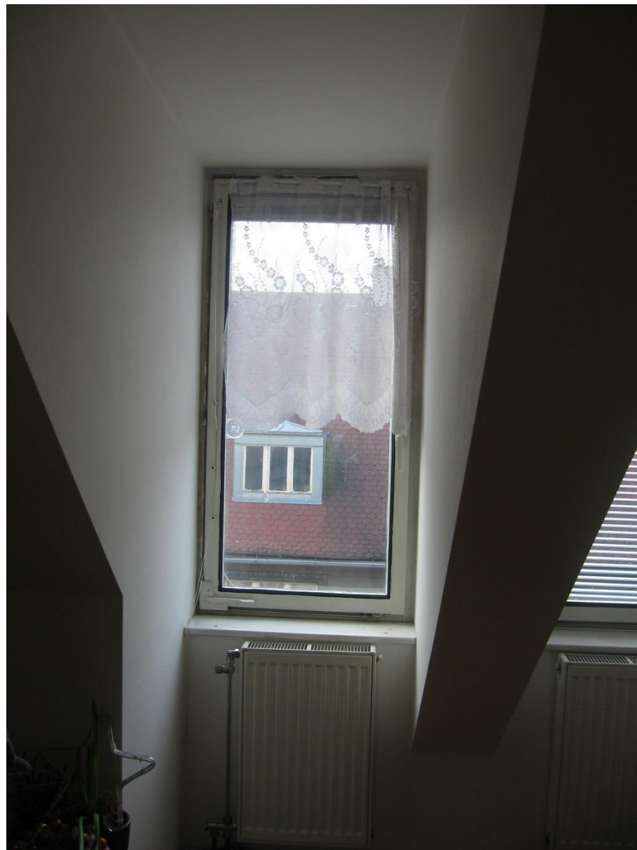
ARKÝŘOVÉ OKNO (BYT)