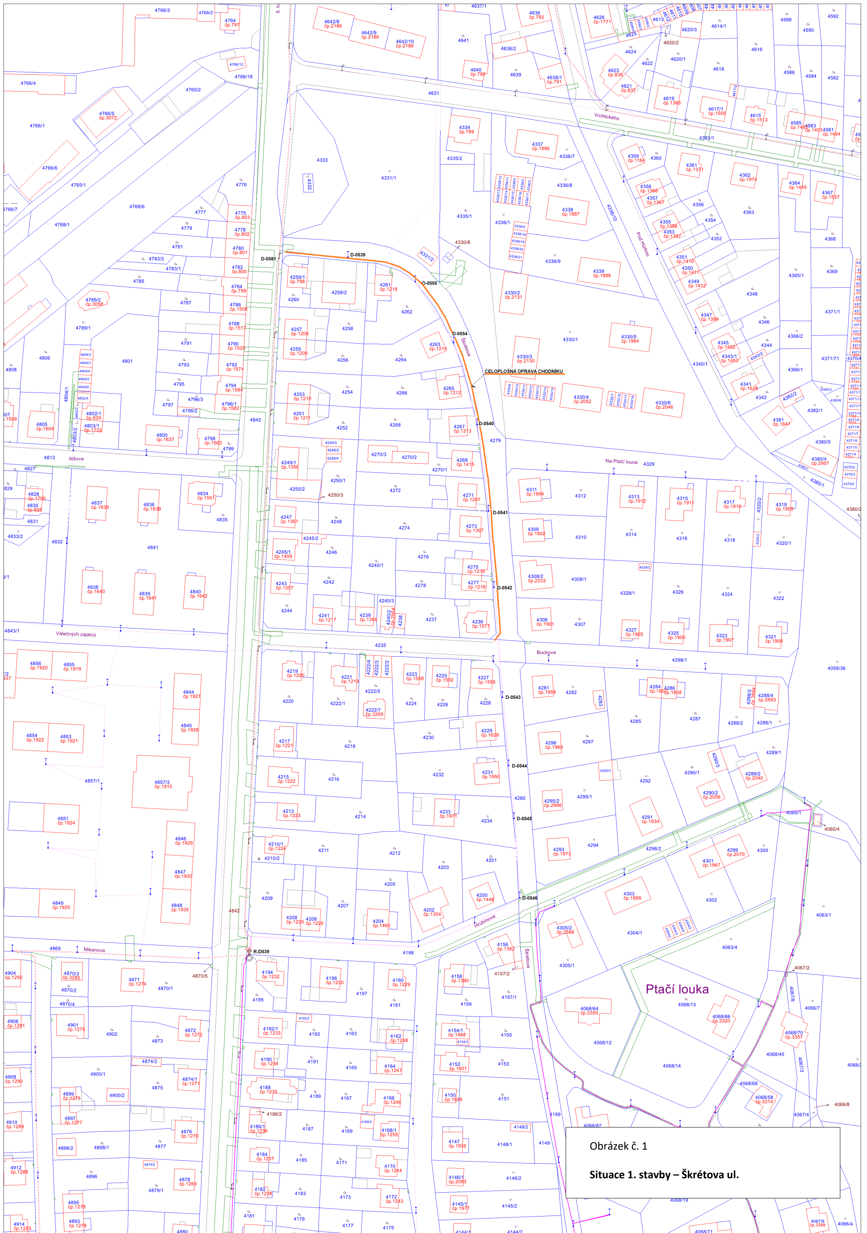
Obrázek č. 1 Situace 1. stavby – Škrétova ul.