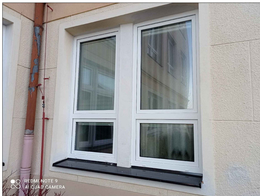
Detail zednického zajištění sestavy z II. etapy (W6)