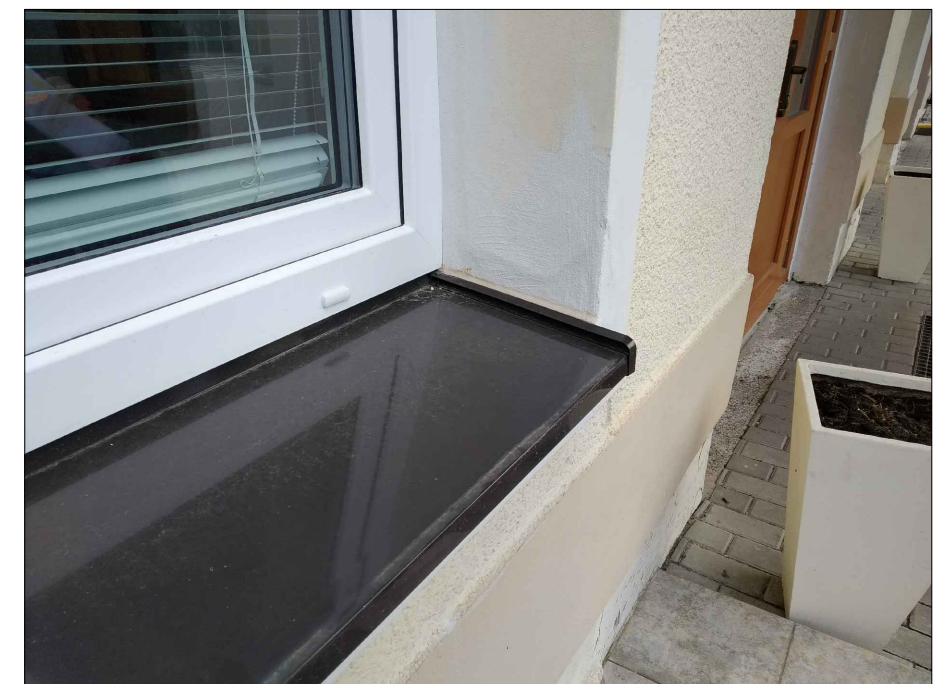
Detail parapetů z I. a II. etapy - nutno dodržet