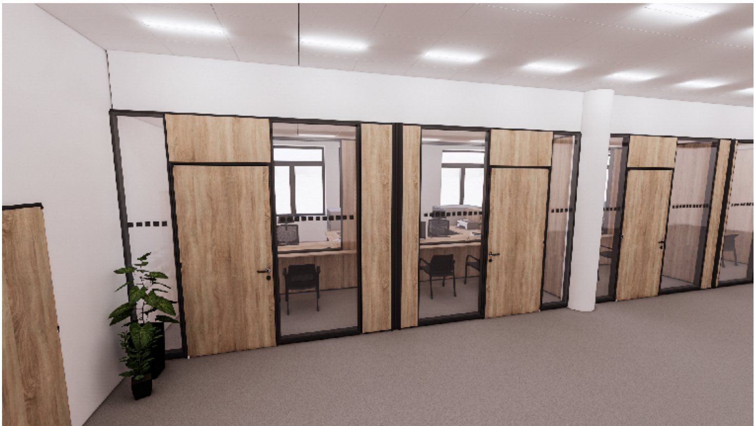
1NP - PŘEPÁŽKOVÁ PRACOVISTĚ REGISTRU VOZIDEL, POHLED Z HALY

VÝŠKOVÝ SYSTÉM Bpv, SOUŘADNICOVÝ JTSK ±0,000 = 251,28m N. M.