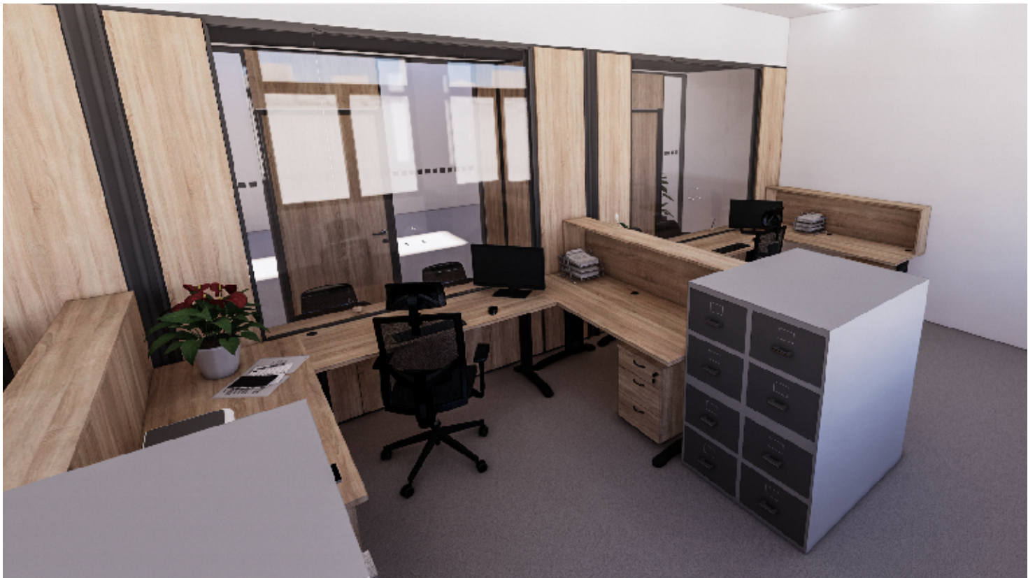
1NP - PŘEPÁŽKOVÁ PRACOVISTĚ REGISTRU VOZIDEL, ZÁZEMÍ