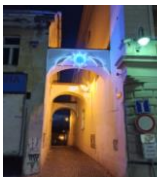
Panská ul. Oblouk