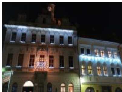
Nám. T.G.M. .Radnice č.p.1 a 2