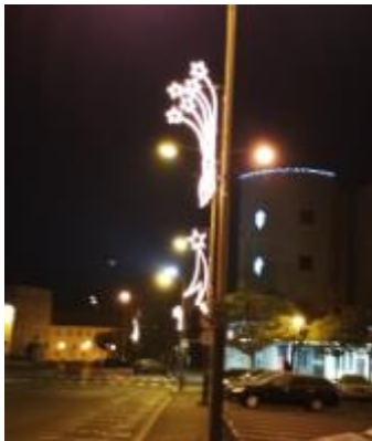
Svazek hvězd a kometa ul. Sokolská