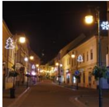
Stromek, vločka Jindřich z Lipé