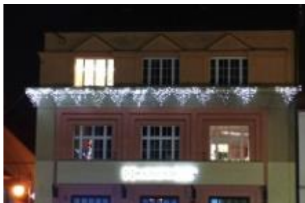
Nám. T.G.M. č.p.128