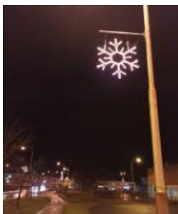
Vločka ul. Sokolská