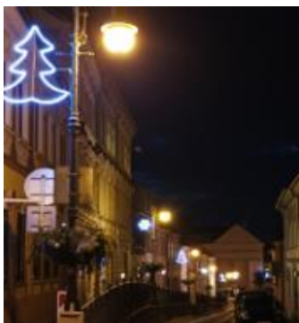
Stromek vločka Moskevská