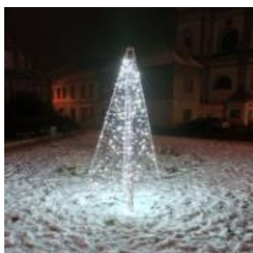
Jehlan Jeřábkovo nám