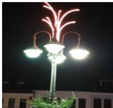
Gejzír nám. T.G.M.