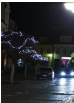
Stroma nám. T.G.M.