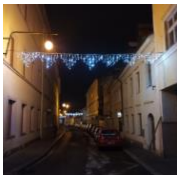
převěsy ul. Paní Zdislavy